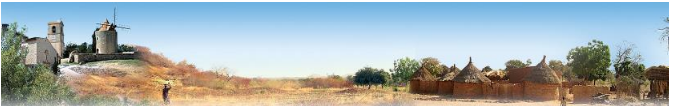
VENTALILI : Échanges solidaires entre Ventabren et Tanlili, au Burkina Faso, et leurs écoles