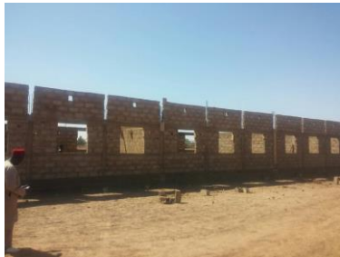
Visite de Monsieur le Maire