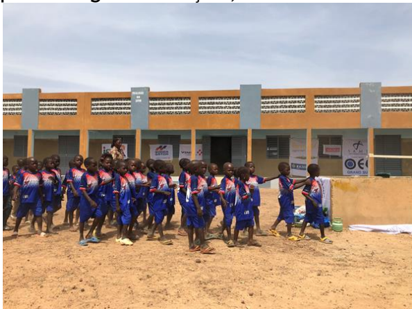
Inauguration Ecole B

Au Burkina il y a 2 années de CP ; la première est consacrée exclusivement à l'apprentissage du français, la seconde rentre dans le cycle normal éducatif.