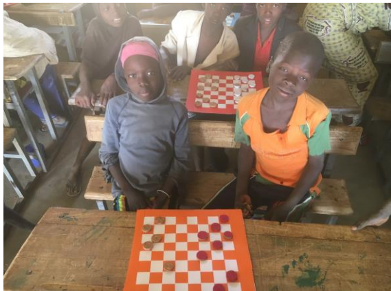
Jeux de dames réalisés par l'école de Ventabren

L'école A est composée de 7 classes ; il y a 435 écoliers allant du CP au CM2 (60 écoliers en moyenne/classe)