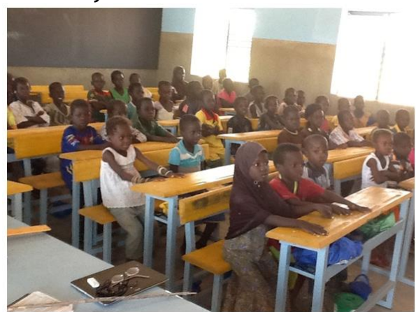
Classe de CP1 - Ecole B